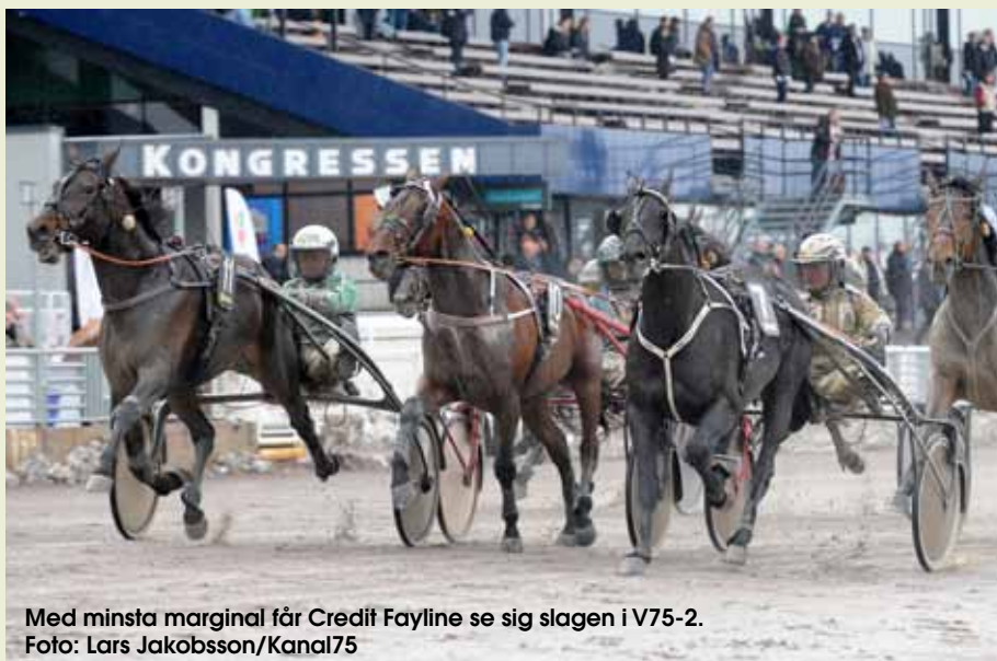
Med minsta marginal får Credit Fayline se sig slagen i V75-2.

Från egna stallet hade Magnus med Credit Fayline som startade i V75:s andra avdelning. Efter den snygga segern i årsdebuten senast var sexåringen nu tillbaka på brottsplatsen och än en gång svarade han för en femstjärnig insats. Det blev rejäl körning från start och när krutröken hade lagt sig satt favoriten Cantab Sisu i ledning och Credit Fayline fanns en bit bak som första häst i andraspår. Trots att han sedan fick gå restena av loppet utan draghjälp