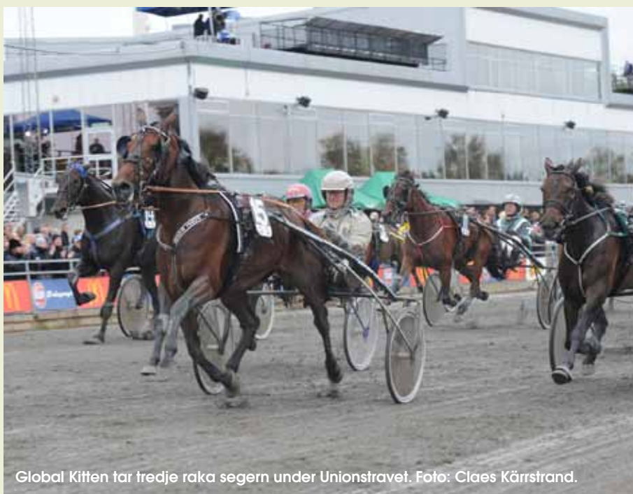
Global Kitten tar tredje raka segern under Unionstravet.

- Vi hade ett jäkla flyt när de flesta gick ner invändigt och jag