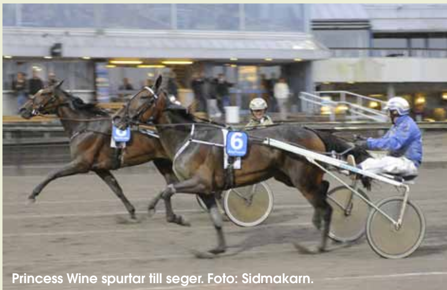
Princess Wine spurtar till seger.