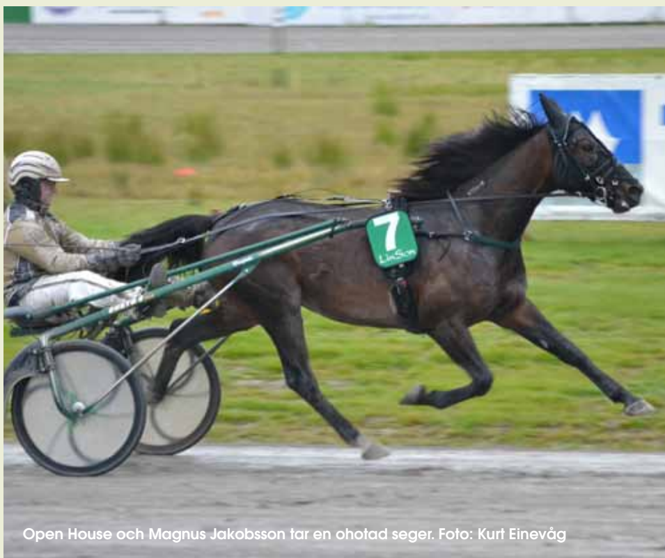
Open House och Magnus Jakobsson tar en ohotad seger.