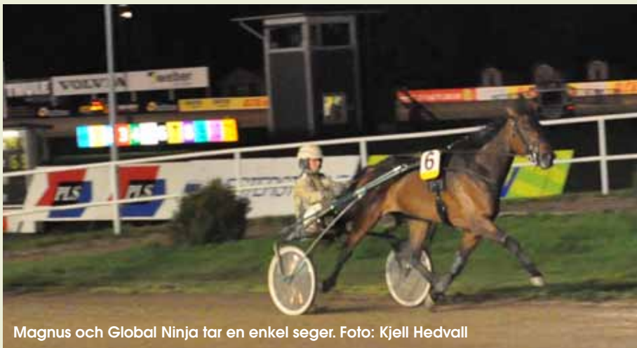
Magnus och Global Ninja tar en enkel seger.

Magnus Jakobsson och Global Ninja spelades till tunga favoriten på Axeval-la igår.