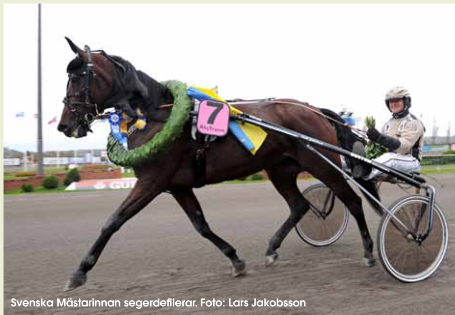
Svenska Mästarinnan segerdefilerar.