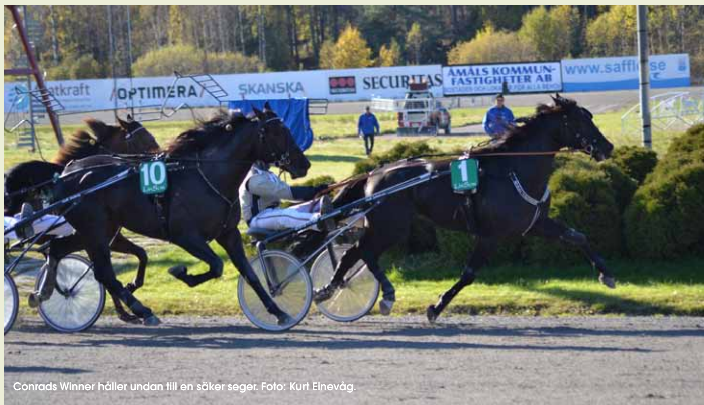
Conrads Winner håller undan till en säker seger.

Conrads Winner är alltjämnt obesegrad för Magnus Jakobsson. Igår gjorde han sin andra start för Färjestadstränaren och även nu blev det seger.