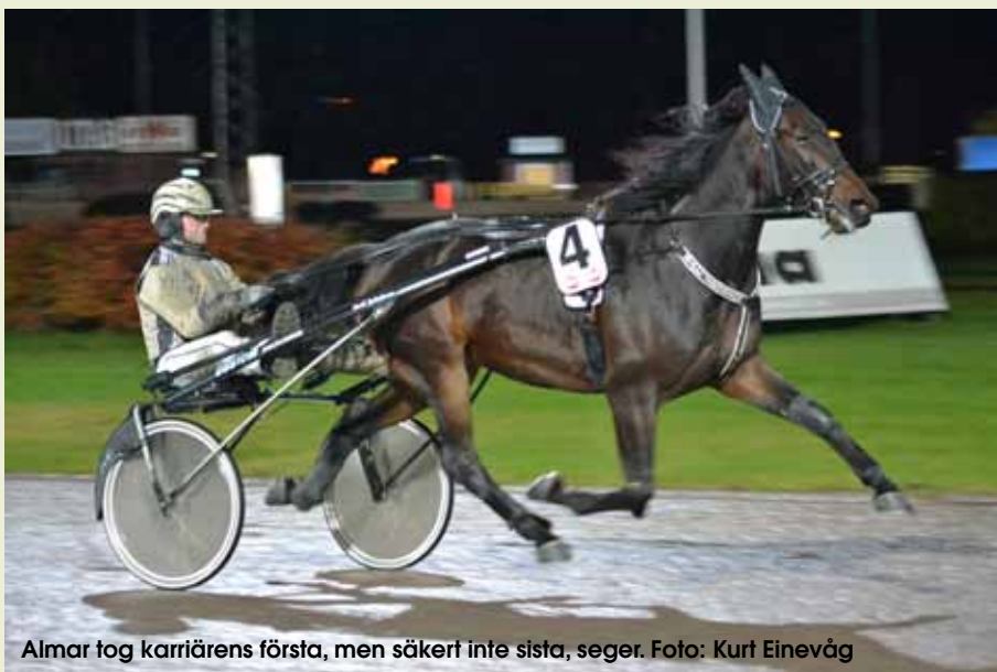
Almar tog karriärens första, men säkert inte sista, seger.

dem för tidigt men jag hade inget val utan han drog iväg själv. Han känns som en riktigt bra häst och jag tror han kommer att bli väldigt allround. Ännu vet han inte riktigt vad det går ut på utan han