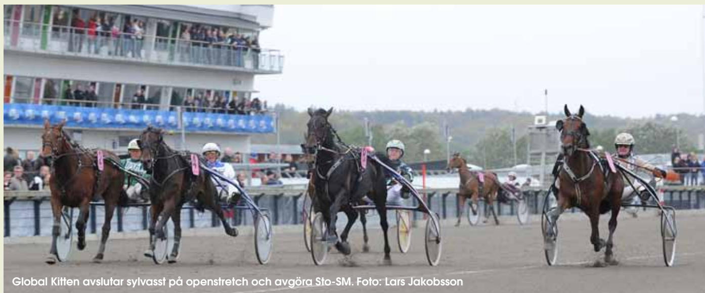
Global Kitten avslutar sylvasst på openstretch och avgöra Sto-SM.

Idag tog Magnus Jakobs-son karriärens största triumf.