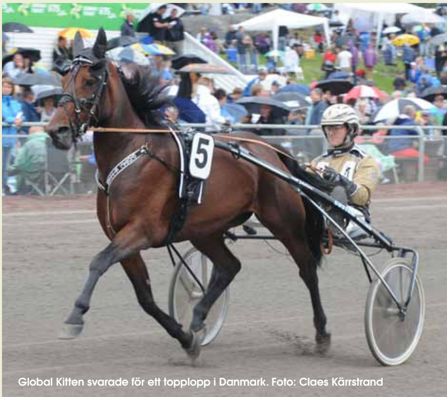
Global Kitten svarade för ett topplopp i Danmark.