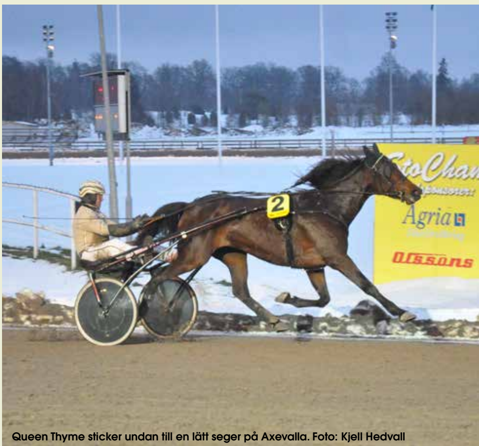
Queen Thyme sticker undan till en lätt seger på Axevalla.